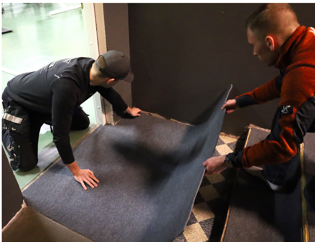
Hela renoveringen görs på talko av Oravais Sportklubbs fyra medlemmar. Här får trappan ner till den stora träningsalen nytt underlag.