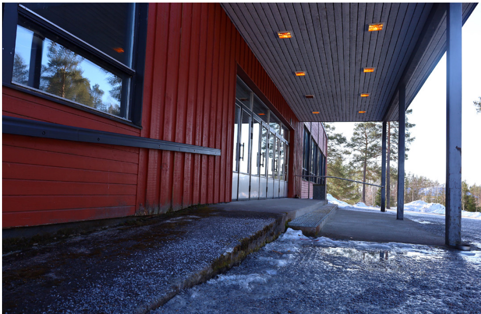
Årvasgården har bland annat fått en ramp upp till dörren för att öka tillgängligheten.