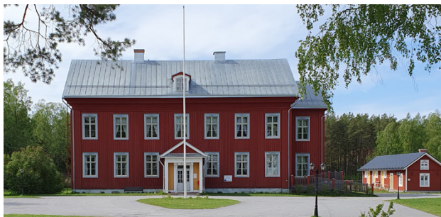
Maxmo Hembygdsförening ordnar träff på Tottesunds herrgård den 24 mars.

Vi saknar ännu material och foton som skildrar livet i byn. Därför riktar vi oss nu till ortsbör, utflyttade och andra som på olika sätt har anknytning