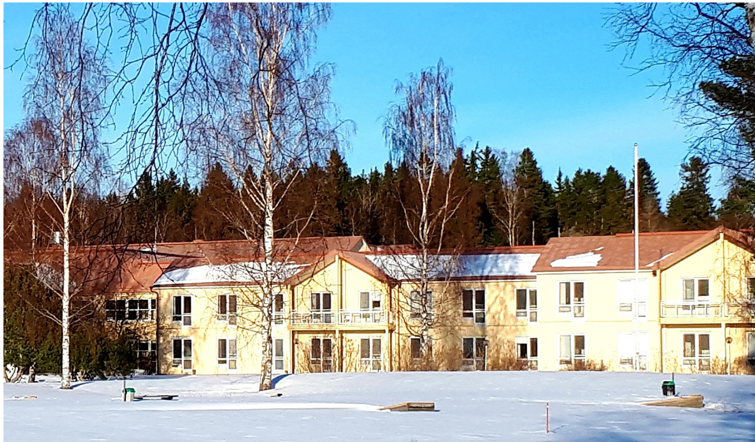
Vörå samgymnasium-idrottsgymnasium har tutorer som på olika sätt arbetar för att öka trivselen.

skola som samarbetar med skolans KiVa-team på så vis att de vid sina regelbundna möten kan lyfta fram ifall det är något de märkt i skolan, om det t.ex. är något bråk på någon klass, som de vuxna kanske ännu ej märkt.