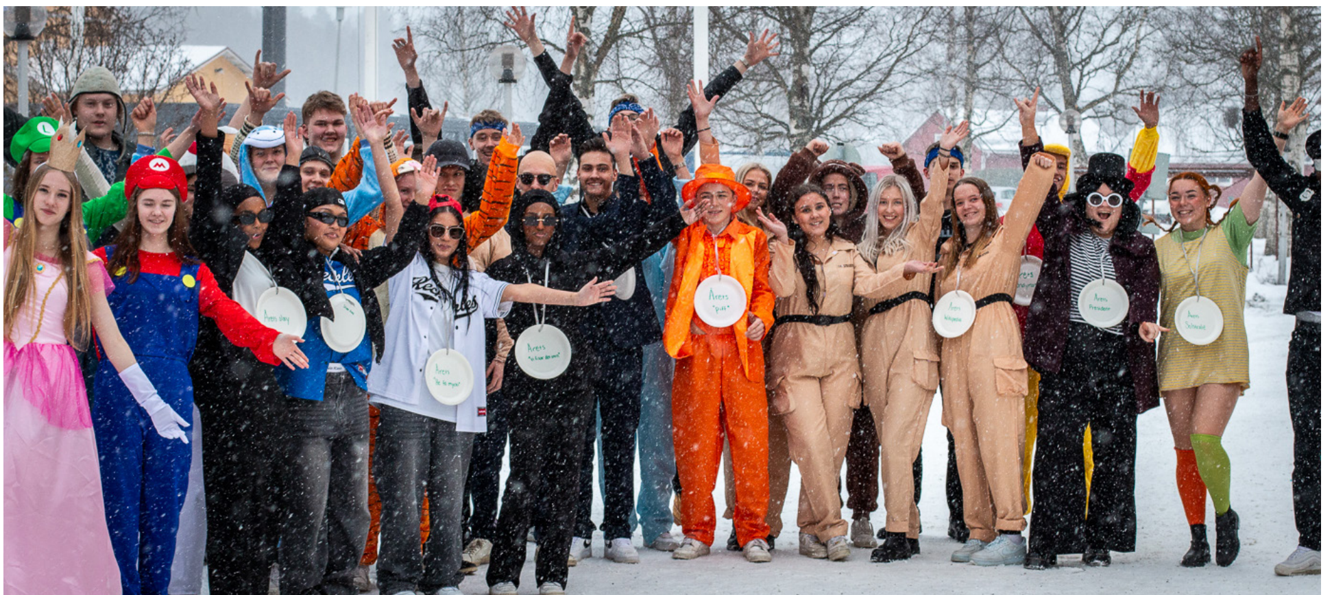
Glada Vörråbiturienter firade penkis innan det var dags att börja plugga till studentskrivningarna.