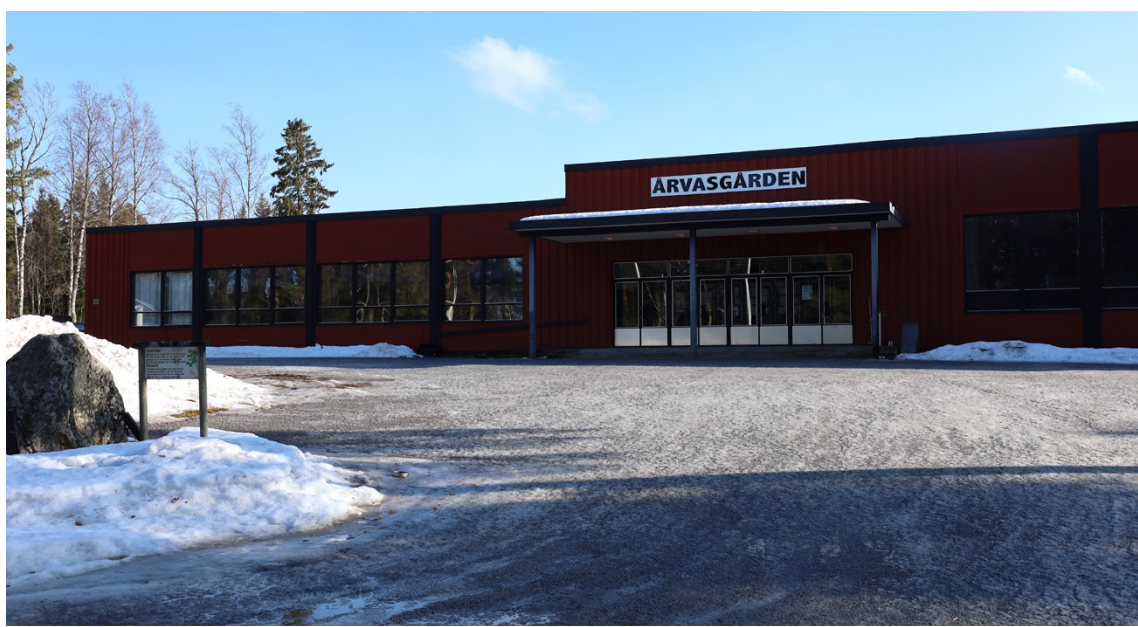
Där det tidigare var en gräsmatta framför Årvasgårdens huvudingång ligger nu en parkering på 900 kvadratmeter. Förhoppningen är att projektet får in mer pengar så gården kan asfalteras.

– När våra föräldrar och medlemmar blev äldre insåg vi att man måste välja vart man får om man är rö-