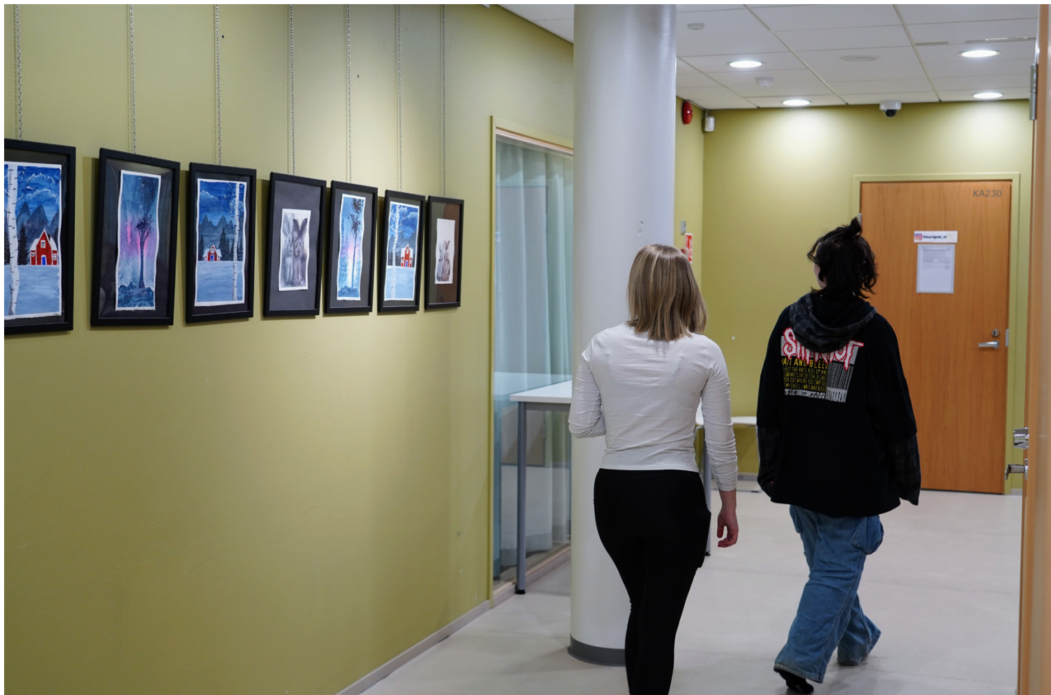
Vöyriläiset nuoret voivat entistä huonommin psyykkisesti ja pahoinvointi voi antaa kasvualustan kiusaamiselle, ilkeille ja päihteiden käytölle. Siksi neuvoston asialistaan sisältyy muun muassa vapaa-ajan toimintaa, luovia harrastuksia ja tapahtumia koskevia kysymyksiä.

–Kun nuorisoneuvosto tuli vierailulle kouluun, tajusin, että voi-