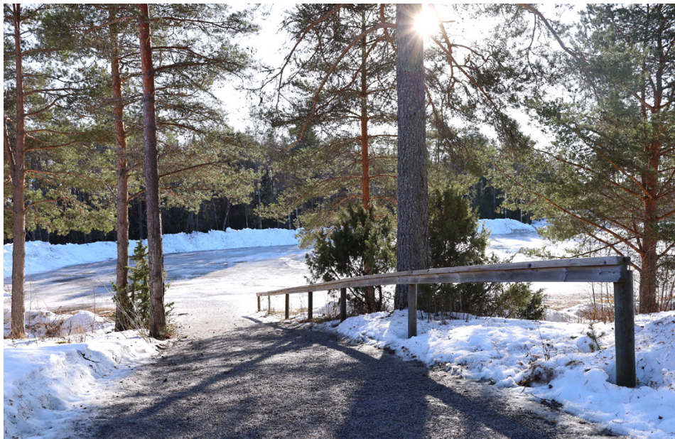
Backen upp till Årvasgården är brant och kan vara svår att ta sig upp för, säger Benita Öling.