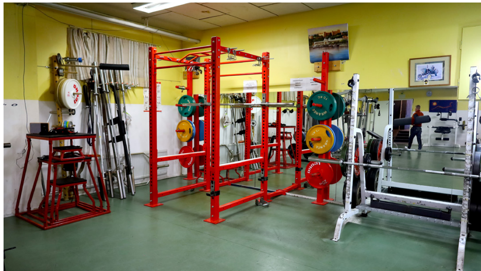
Den stora träningsalen är de kommande månadernas stora utmaning. Här ska man lägga nytt golv och måla väggarna i grått och vitt.

● När Oravais Sportklubb tog över gymmet i Årvasgården förra våren inledde man samtidigt en omfattande renovering. Arbetet sköts helt på talko av föreningens fyra medlemmar – som gör allt från att måla väggar och lägga golv till att jaga finansierare för projektet.