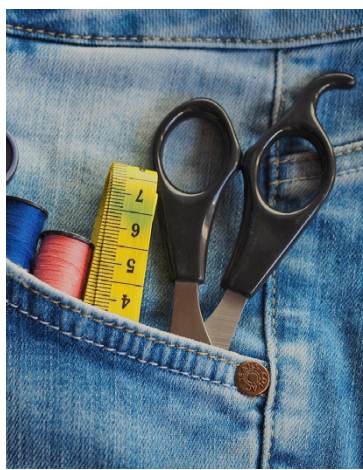
tingen i skola, på fritiden eller via någon förening.

Vi har tre olika avgiftsfria föreläsningar på kommande som har viktiga teman, både för dig som förälder men också för dig som på olika sätt arbetar med barn och unga an-