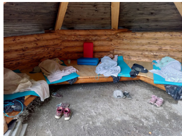
Bild från då barnen sov i vindskyddet i augusti.