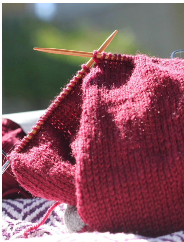
Det ordnas stick- och virkcafé i Byagården i Djupsund 10 oktober.