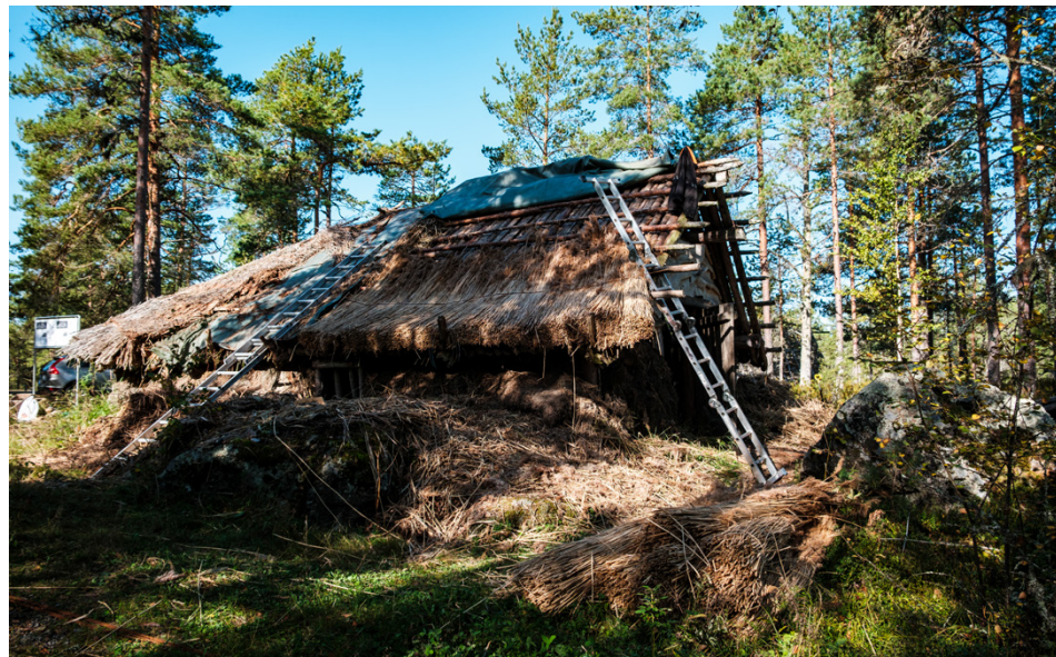
Bronsåldershuset i Vitmossen byggdes för tjugo år sedan. Nu får det nytt tak.