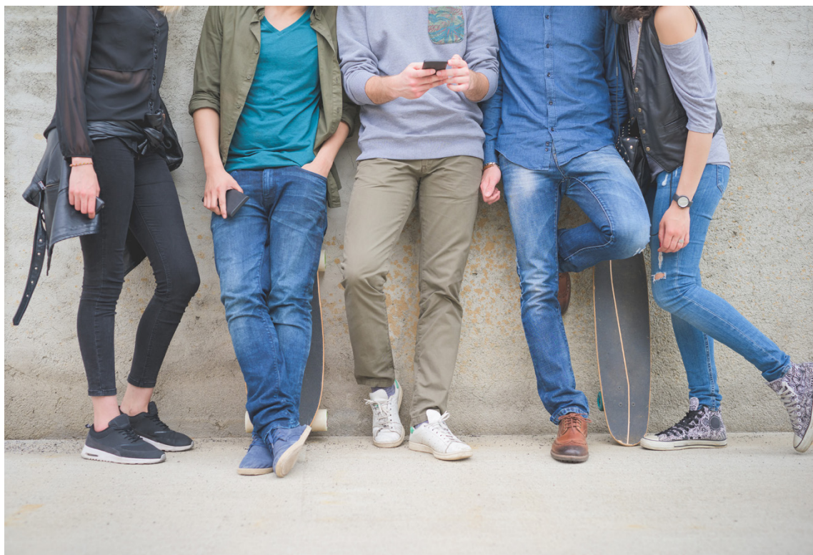
Vörå kommun har inlett processen att bli en barnvänlig kommun.

GÅRDUIÅK 1–4: rita, skriv eller berätta på annat vis vad du tycker om Vörå som din kommun, vad som är viktigt för dig och vad som skulle göra Vörå till en bättre plats för barn? Mallen finns att printa ut på www.vora.fi/barnvanligkommun , eller så får du den via biblioteket. Ditt bidrag lämnar du in till något av biblioteken eller bokbussen.