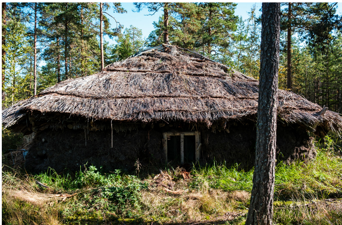
Bronsåldershuset är beläget i Vitmossen. Bredvid finns en vandringsled.

vänligt material som finns i rikliga mängder. Det går bra att använda vass som takmaterial på nya hus. Jag har till exempel lagt vass på tre sommarstugor, men ännu har jag