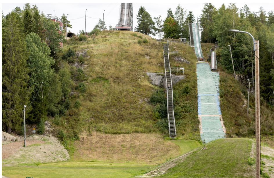
Backhoppningstrapporna används redan som en sorts motionstrappa.

Förutom planeringen av området har man även börjat planera hur skidstugan och faciliteterna intill kunde se ut i framtiden. I början av september presenterade Martin Norrgård, som är anställd