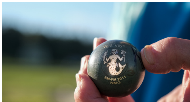
Minigolfspelare kan designa sina egna bollar. Så här ser en boll ut med Vörå kommunvapen som motiv.