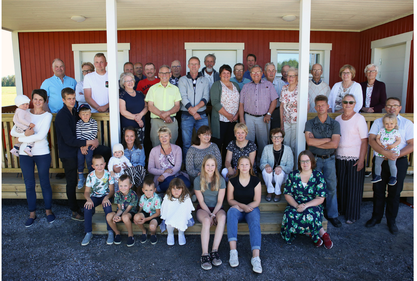
Byafotot över Österbyborna förnyades under invigningen. Det förra byafotot togs i början av 90-talet.

Det förra servicehuset brann tragiskt ned under sommaren 2018. Som tur var huset försäkrat och kommunen tog beslutet att bygga upp huset på nytt. I samband med planeringen uppdaterades rumsfördelningen så att det nya servicehuset skulle bli mera ändamålsenligt. Det nya servicehuset är idag handikappanpassat, med mö-