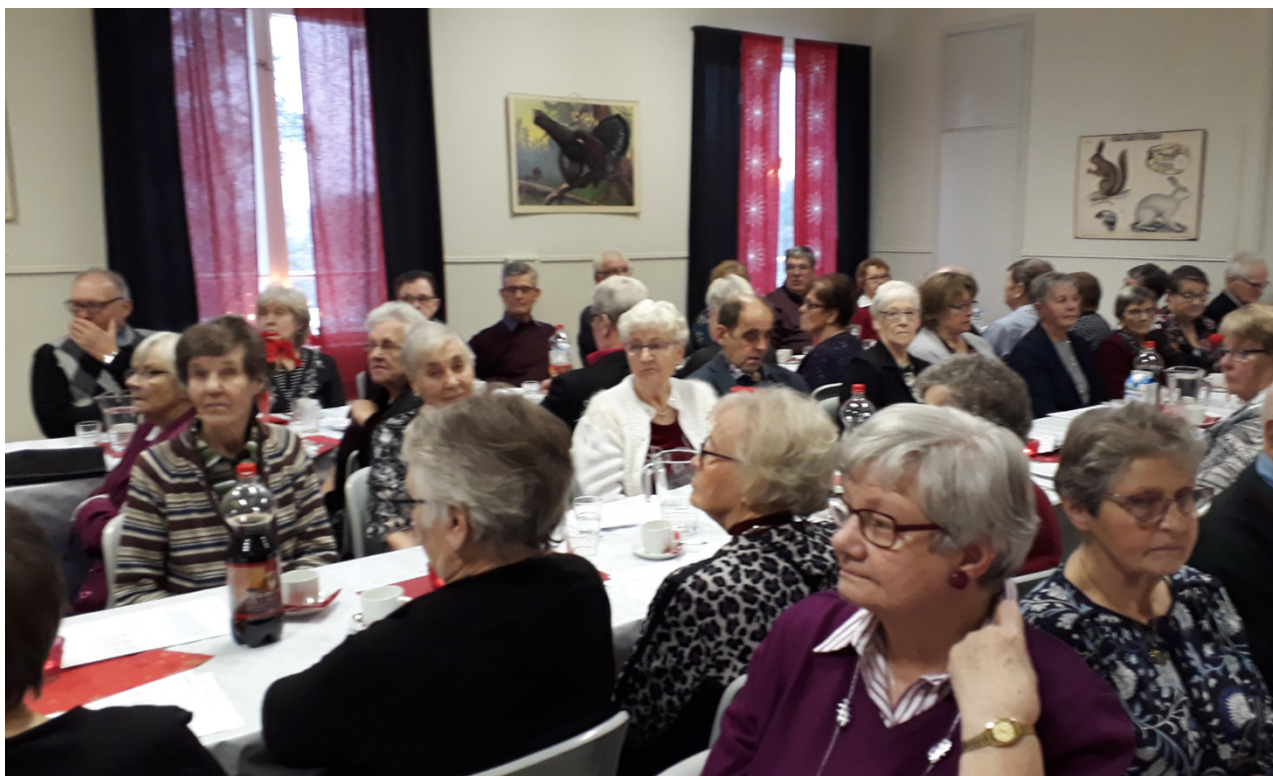
Gemensamma julfesten i Tälamods skola 17.12.2019.