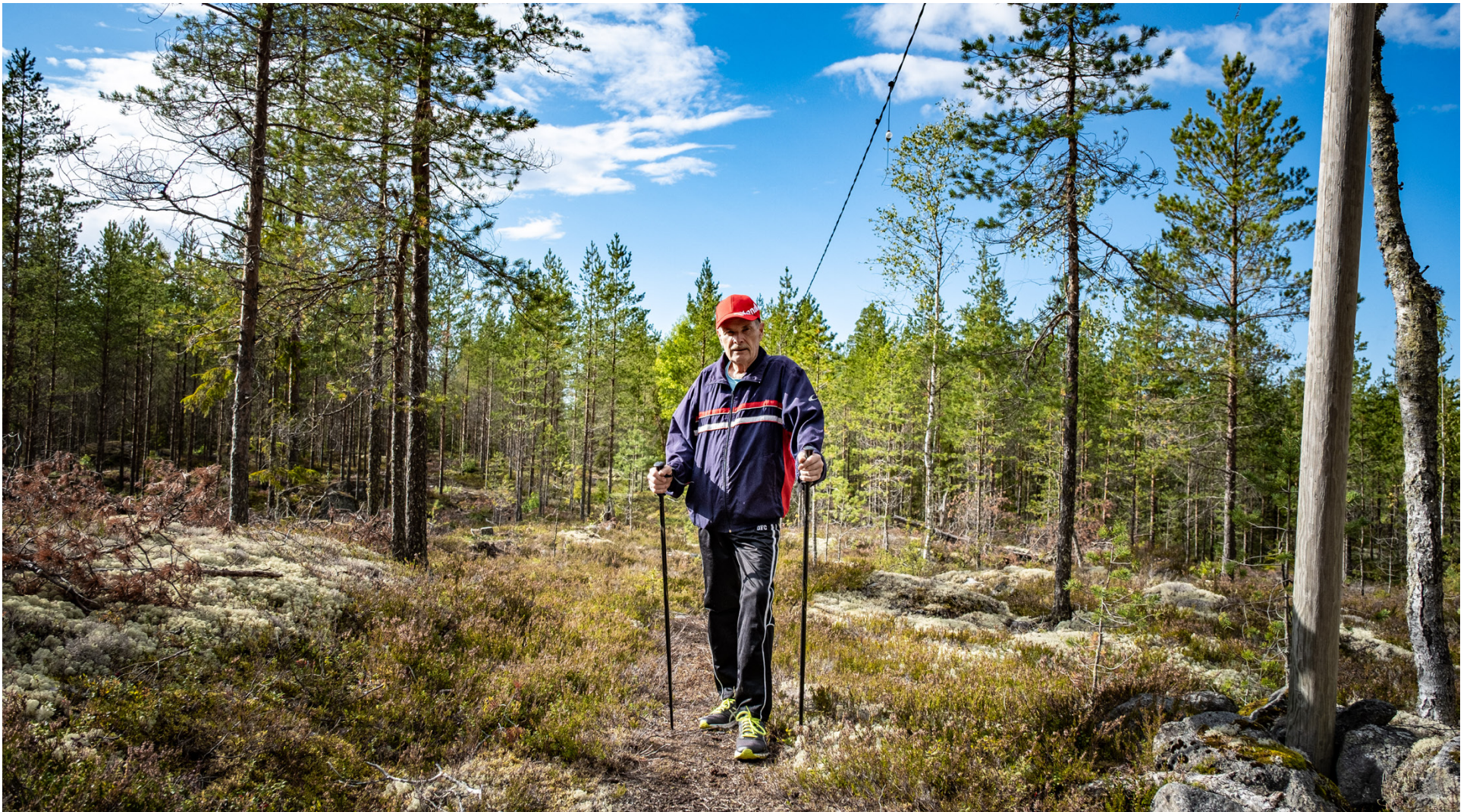
Vandringsstigen är absolut värd att vandra. Ett tips är att ta med ett ämbare och ta tillvara på blåbären som växer längs kanten.