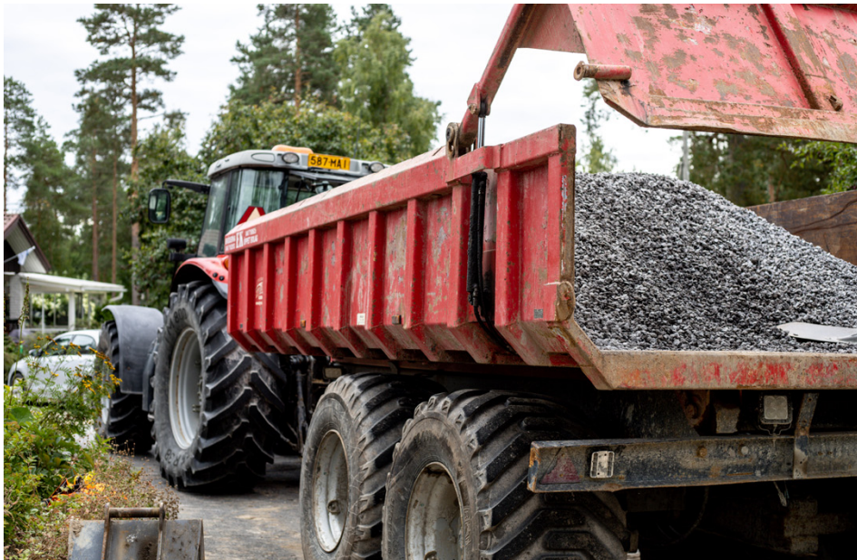
RSW Byggtjänst har en egen traktor till förfogande.