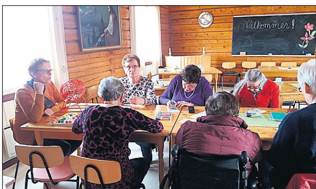
Mimoselgruppen i Kvimo spelar bingo.

Programmet varierar från gång till gång och kan bestå av diskussioner om aktuella