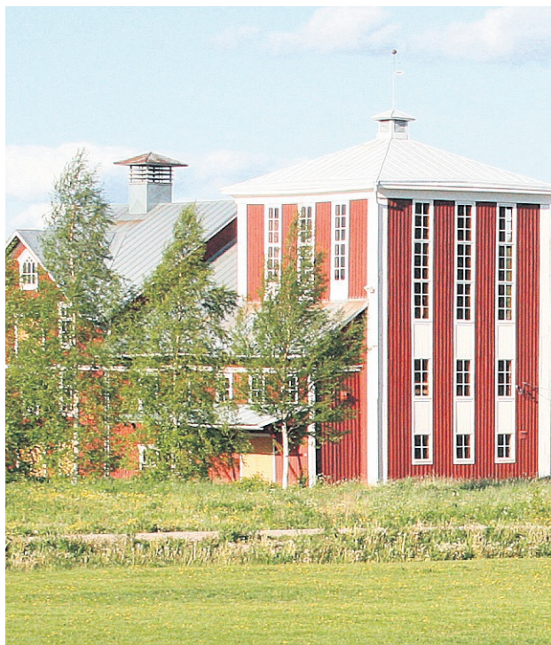
Rökiö Kvarnstuga hyser rum för Hägglunds fotomuseum.