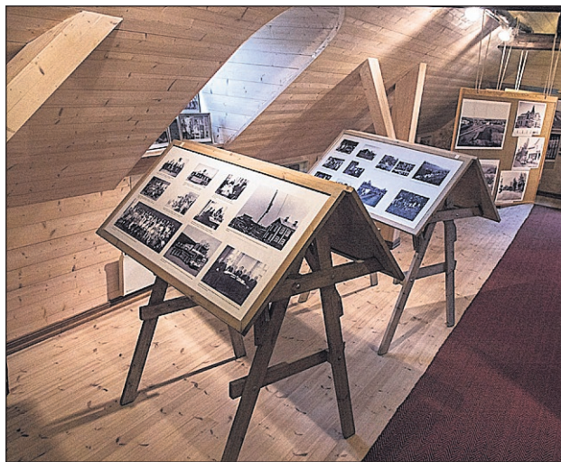
Den nya sektionen innehåller bilder från Vörånejden och visar hur samhället utvecklats.