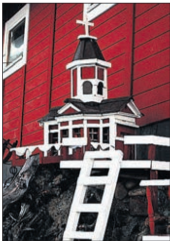
Kyrkan står högst upp.