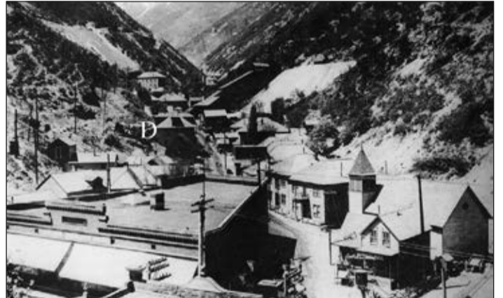
Dahlströms boardinghus i Bingham. Denna del av Bingham Canyon hette Carr Fork och beboddes av österbottningar. Det stora huset rakt ovanför Dahlströms var Swede Hall, österbottningarnas föreningshus.