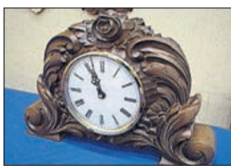
Puutyö ja koristeveisto.

Joillekin kurseille voi ilmoittautua jo viikolla 51. Useimmat kurssit avataan kuitenkin 7. tammikuuta 2014 kello 13-17, jolloin puhelimitse ilmoittautuminen kursseille alkaa. Tämän jälkeen otetaan ilmoittautumi-