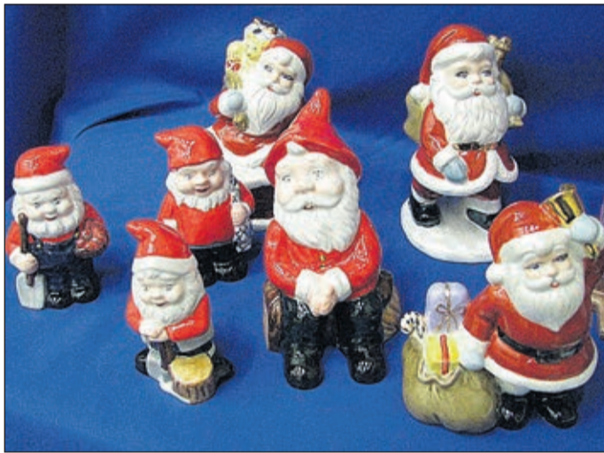
Mopedrestaurering, nytt av kaffepaket, hjärta till vännen, risdekorationer och keramik.

Exempel på föreläsningar under vårterminen är Finlands-svenska ättlingar i USA , Lär dig tala inför publik och Grunderna i röstergonomi .